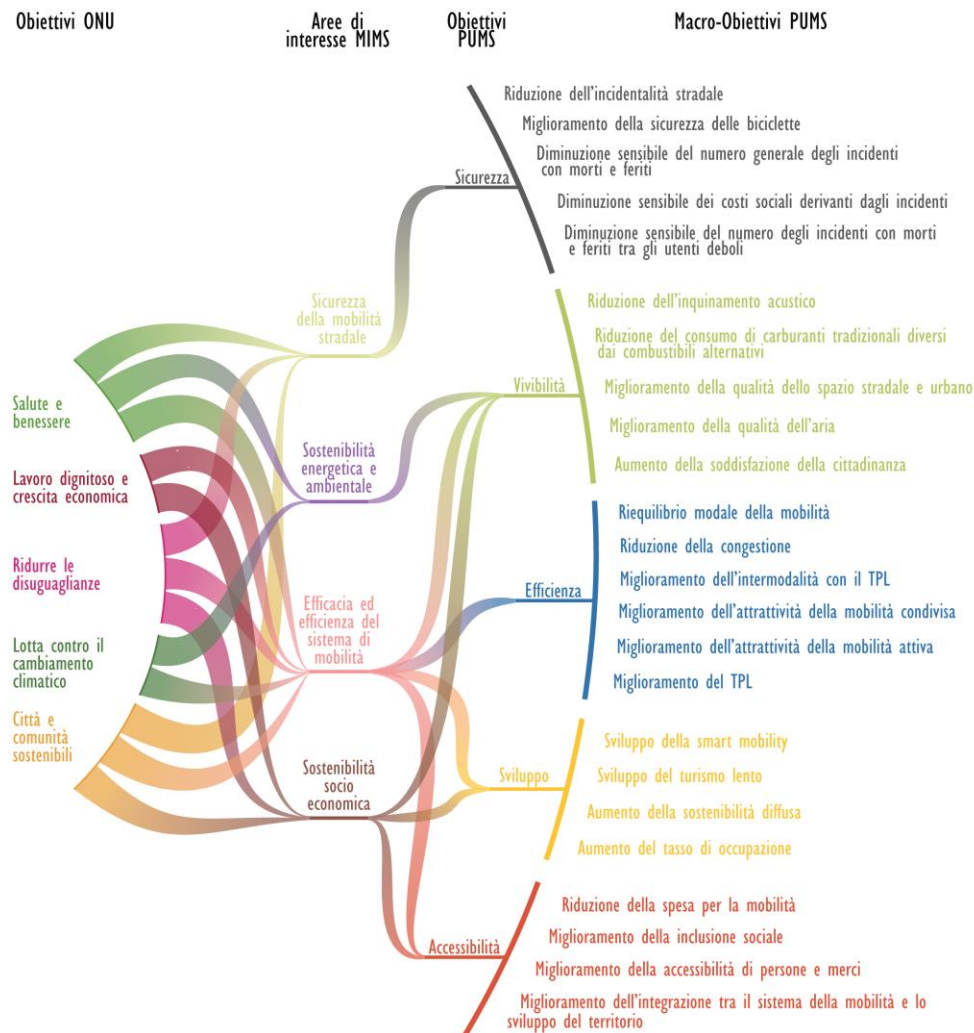
Figura 3.1 Legame tra gli obiettivi di sviluppo sostenibile dell'Agenda 2030 e gli obiettivi generali del PUMS metropolitano.

Uno schema rappresentativo delle corrispondenze che legano il PUMS della Città metropolitana di Roma Capitale con le aree di interesse del MIMS e l'Agenda 2030 dell'ONU è osservabile nella Figura 3.1 4 .